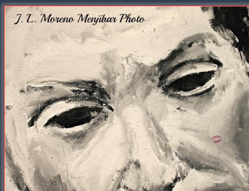
Fragmento de un rostro en un graffiti callejero