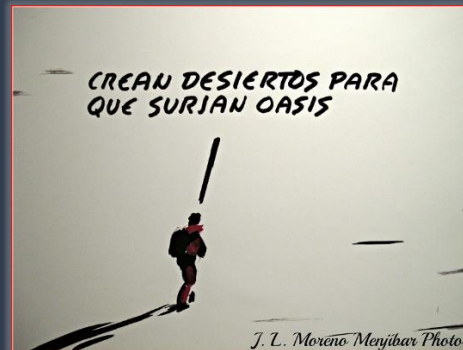
Reproducción de Viñeta de "El Roto" – C.A.C.