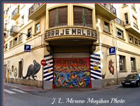
Fachadas Frontales y Laterales del Garaje Málaga