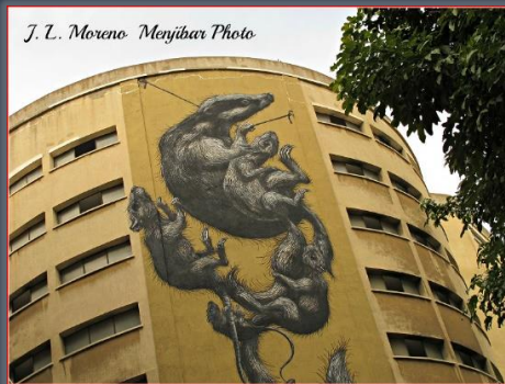
Mural de Ratas en la Fachada de un Garaje