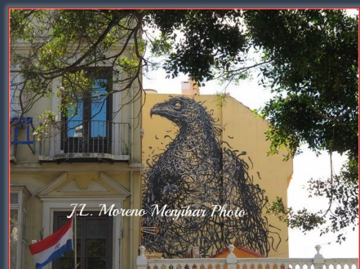
Mural de Aguila en una Terraza