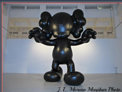
Reproducción Fotográfica de Escultura - CAC