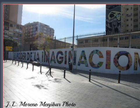
Leyenda Mural del C.E.I.P. Federico García Lorca