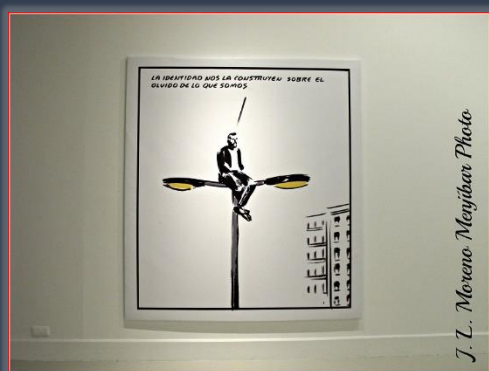
Viñeta de gran tamaño de “El Roto” - CAC