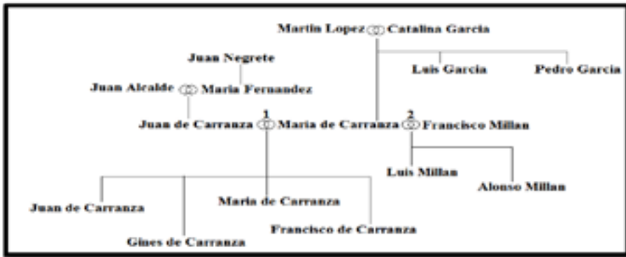
Figura 2: Antecedentes familiares