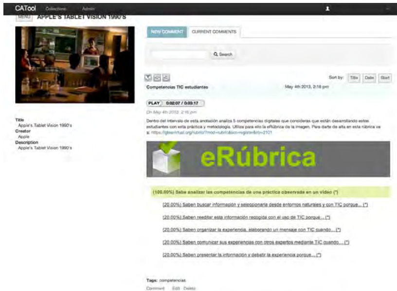
Imagen 1 de la herramienta erúbrica integrada en anotaciones CaTool.

cuando alguien recibiera un mensaje con una anotación, con un solo clic le llevarse a la anotación específica realizada dentro del recurso; d) Editar etiquetas dentro de una base de datos de anotaciones ontológicas; e) De forma opcional, que cada anotación tuviera la posibilidad de geolocalización; f) Que las anotaciones pudieran compartirse fácilmente por las redes sociales; g) Que en la edición de las anotaciones pudieran crearse erúbricas.