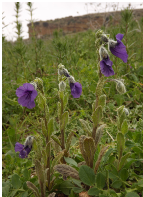
Figura 2. Ejemplares de Triguera osbeckii fotografiados en Marzo de 2013. Obsérvese el escarpe de La Cueva de la Batida al fondo.

Dicha población es de especial relevancia histórica al coincidir su localización con la de los materiales que motivaron la descripción del género. Triguera osbeckii fue descrita originalmente por Linneo (1753) con el nombre Verbascum osbeckii , a partir de materiales españoles, probablemente de la provincia de Cádiz, recolectados por Osbeck (Hansen & Hansen, 1973; Aguilar Piñal & Valdés Castrillón, 1998). Posteriormente, el religioso, humanista y botánico aficionado afincado en