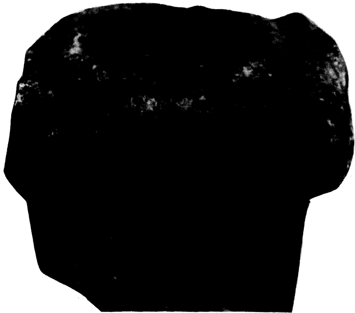
2.— DETALLE DEL CORONAMIENTO.