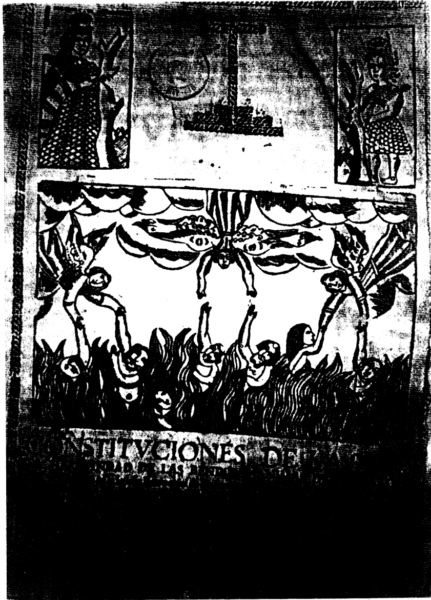
Portada de las Constituciones de la Hermandad de las Benditas Animas del Purgatorio de la Iglesia Parroquial de los Santos Mártires (1672)