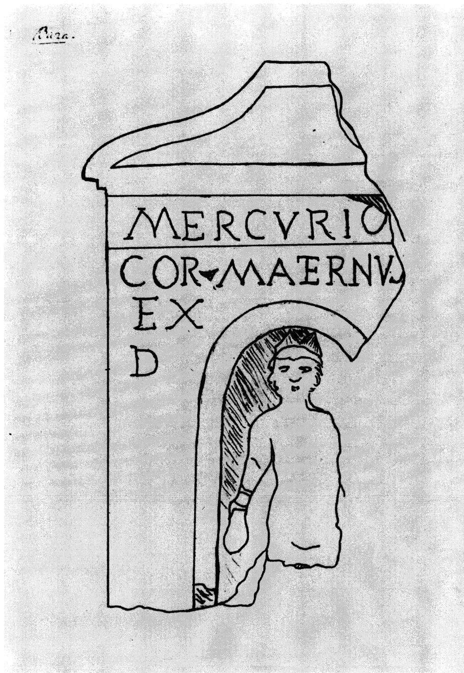
Lámina 2. Mercurio de Baza, según MS. de la R.A.H.