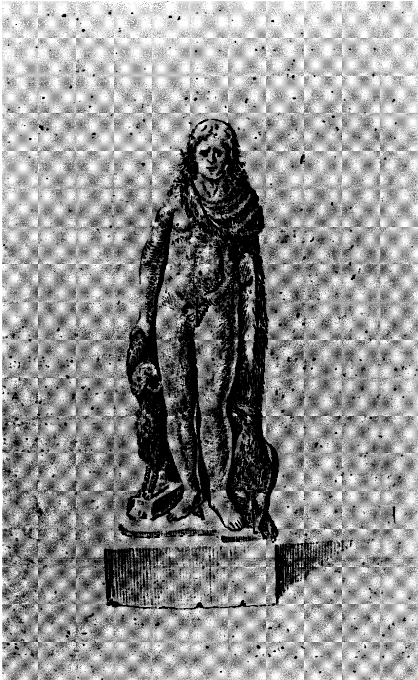
Lámina 1. Escultura de Adra según F. Pérez Bayer